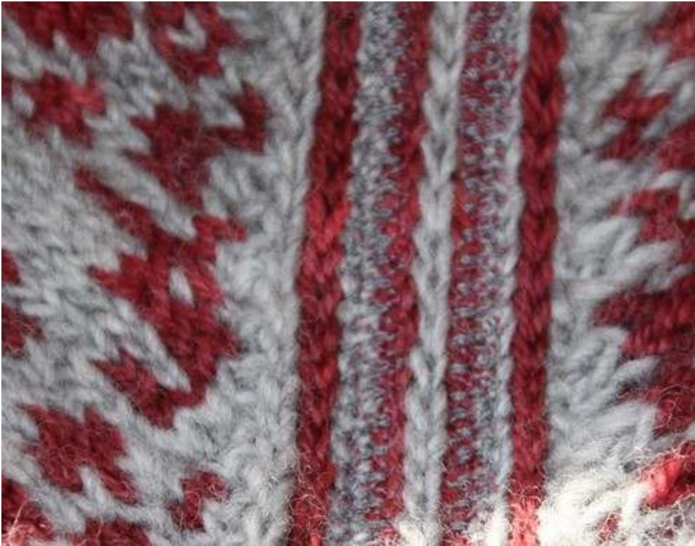
Photo7 : découpage des steeks