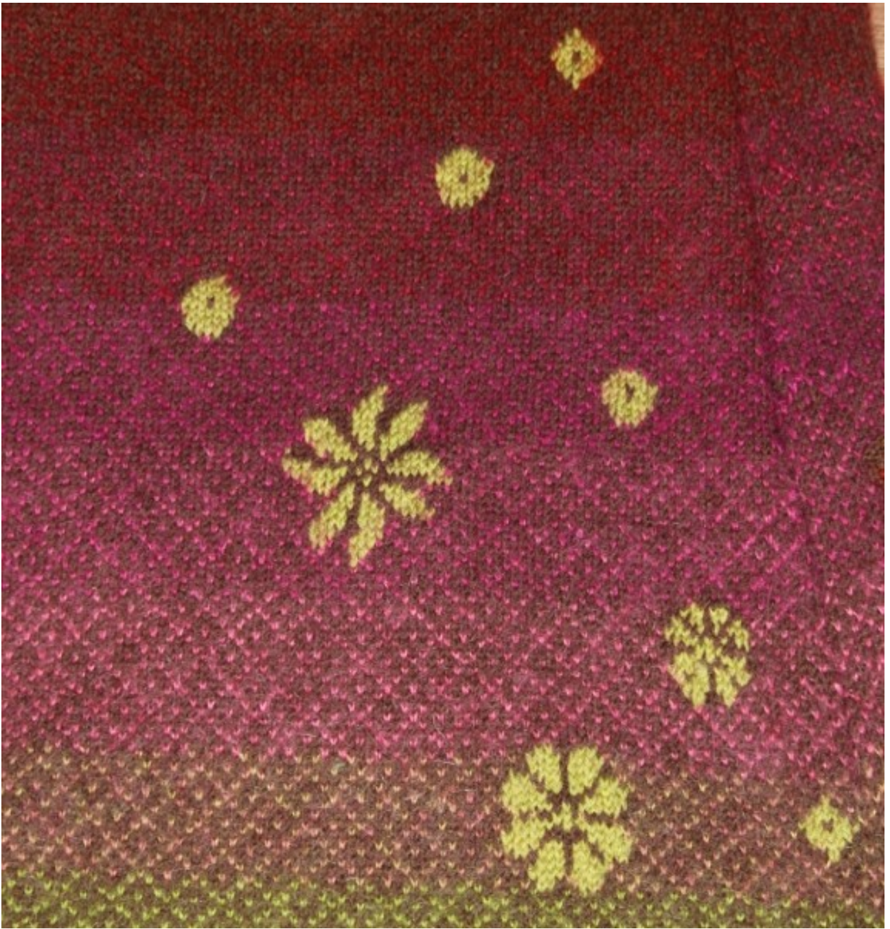
FLEURS DU DOS